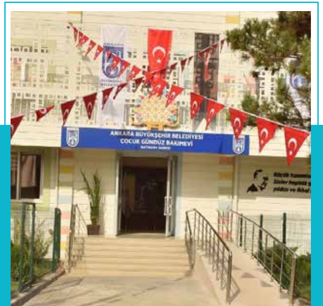
Batıkent Çocuk Gündüz Bakımevi