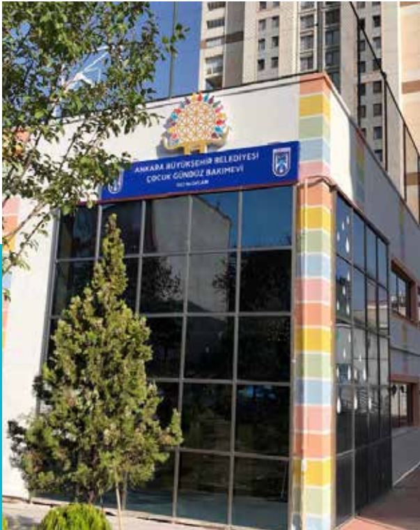
İşçi Blokları Çocuk Gündüz Bakımevi

Sosyal Hizmetler Dairesi Başkanlığı Çocuk Evleri Şube Müdürlüğü'nce yürütülen Çocuk Gündüz Bakımevi plan ve çalışmalarla ilgili daire başkanlıklarıyla koordineli olarak yürütülmektedir.