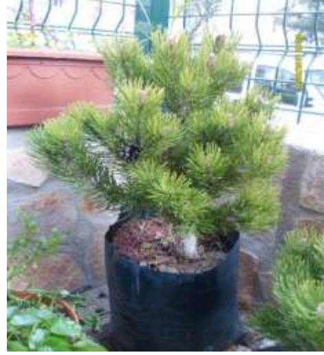
BODUR KARA ÇAM