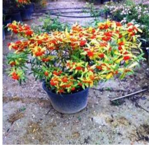
BODUR ATEŞ DİKENİ