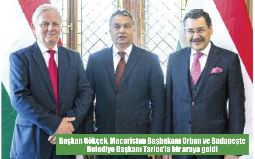
Başkan Gökçek, Macaristan Başbakanı Orban ve Budapeşte Belediye Başkanı Tarlos'la bir araya geldi

Budapeşte'de Osmanlı dönemi eserlerini ziyaret eden Başkan Melih Gökçek, Budapeşte Belediye Başkanı Istvan Tarlos ile birlikte " Ankara Fotoğrafları Sergisi " ile şehrin en prestijli bölgelerinden birinde bulunan " Ankara Caddesi "nin açılışlarını da gerçekleştirdi.