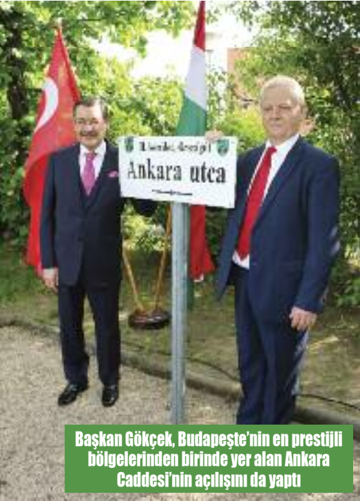
Başkan Gökçek, Budapeşte'nin en prestijli bölgelerinden birinde yer alan Ankara Caddesi'nin açılışını da yaptı