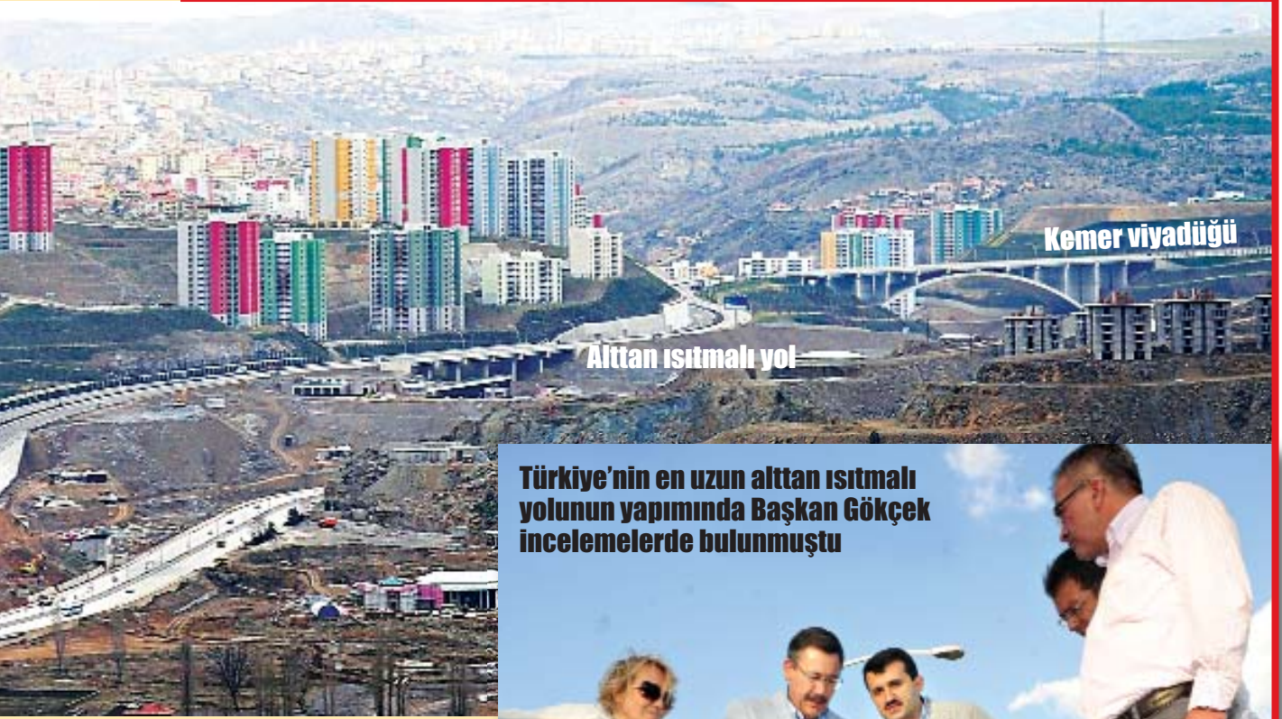
Alttan ısıtmalı yol