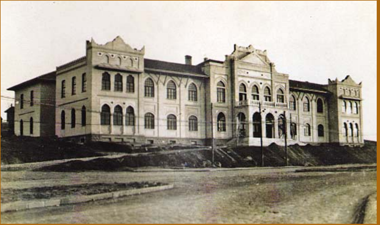
1927'den 2013'e Opera'daki eski Dışişleri Bakanlığı (Bugünkü Kültür Bakanlığı)