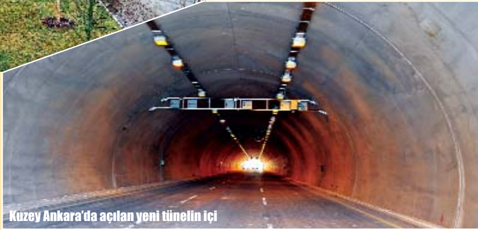
Kuzey Ankara'da açılan yeni tünelin içi