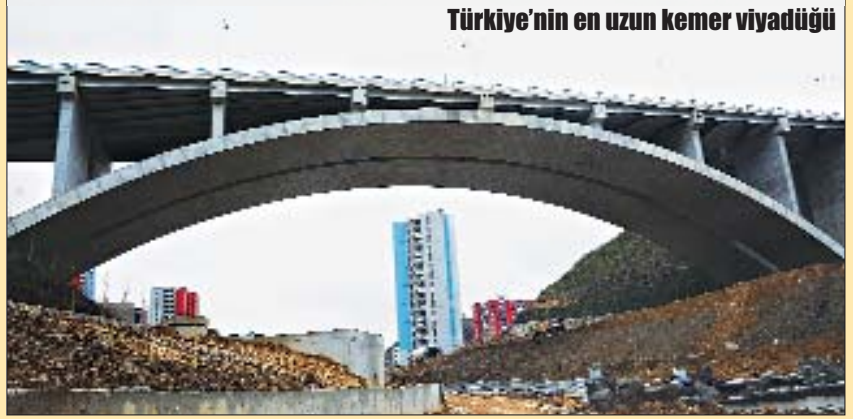
Türkiye'nin en uzun kemer viyadüğü

“Kuzey Ankara Projesi içindeki yol yapım güzergahında inşa edilen iki viyadükten biri Türkiye’nin en uzun açıklıklı betonarme kemer viyadüğü olma özelliğine sahip olacak. 40 metre yükseklikteki viyadük, kemer kısmı 160 metre olmak üzere toplamda 230 metre uzunlukta inşa edildi. Ayrıca yine aynı alanda 2 adet köprülü kavşağın da inşası gerçekleştirildi” diye konuştu.